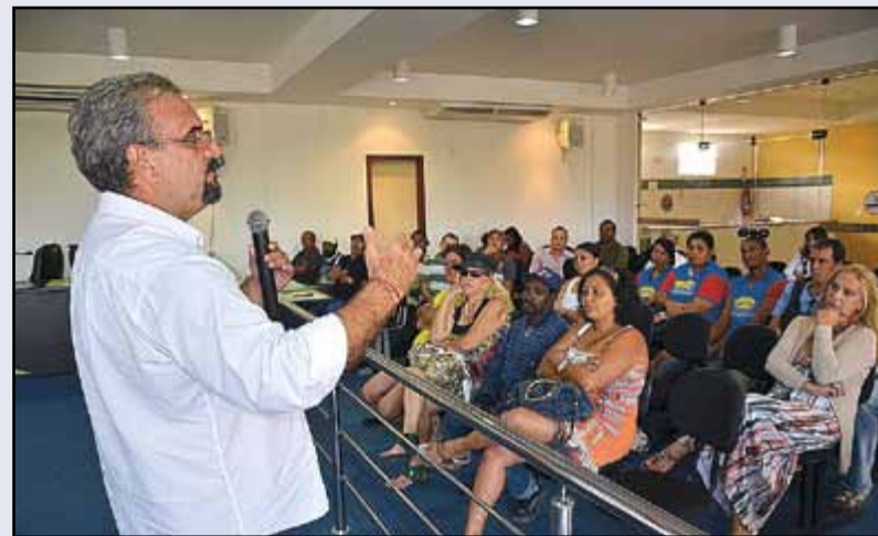
O deputado estadual pelo Partido dos Trabalhadores (PT), Marcelino Galo