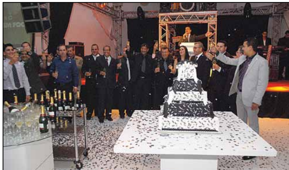
Um brinde ao sucesso

Estavam presentes na ocasião diversas autoridades, políticos, personalidades, empresários e a imprensa regional.