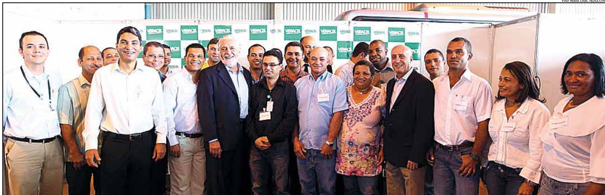
O aniversário da Veracel teve momentos de descontração entre o governador da BA, o presidente da Veracel e colaboradores

representam uma parcela pequena do total de funcionários da Veracel, cerca de 400, o que significa que são funcionários de poder aquisitivo elevado e que, por isso, também investem em cultura, que significa escola e cursos de inglês, de Kumon, de música, de tênis”, explicou.