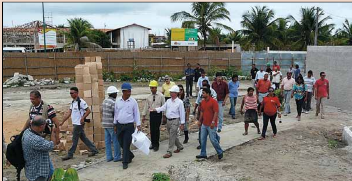
Obras em andamento

No roteiro de visitas, que aconteceu após a realização de um coffee break, foram visitadas as seguintes obras: AME -Policlínica com 14 especialidades médicas em Nova Cabrália – AME (Ambulatório de Especialidades Médicas); Sistema de Abastecimento de Água do bairro Geraldão; 60 Casas do Programa Minha Casa Minha Vida; Postos de Saúde; Nova Escola Nair Sambraño, construída com recursos próprios; Praça da Juventude; e a Casa do Pescador. A visita foi encerrada no Hotel Bahia Cabrália, com um almoço de confraternização.