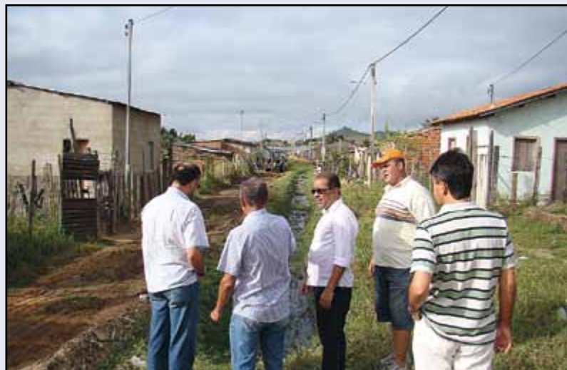
O bairro receberá obras de saneamento básico

Enquanto o PAC não vem, o poder executivo de Itororó não para.