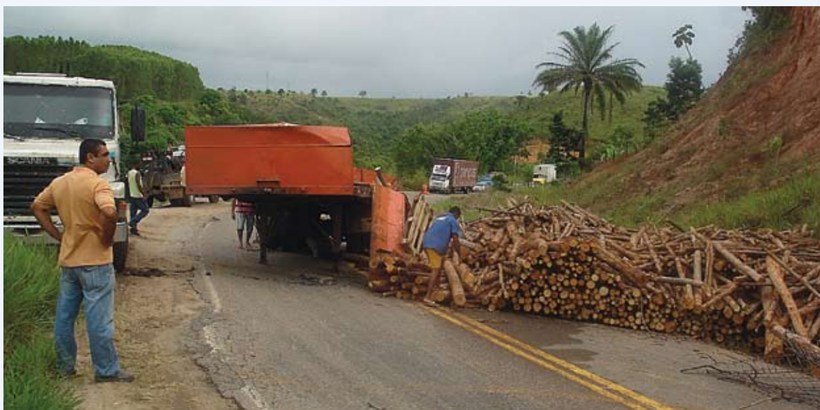
Ao desviar de buracos na pista, carreta carregada com toras de eucalipto teve a sua carga tombada na estrada, colocando em risco as vidas de outros motoristas

Vários motoristas que estavam no local disseram que a rodovia está sendo chamada de “Estrada da Morte”, ressaltando que isso é um crime contra a vida humana e que o trecho de Itamaraju, até a divisa com o Espírito Santo, sendo Muricuri o último município baiano. A reportagem do jornal O Sollo procurou a PRF em Teixeira de Freitas e um inspetor afirmou que os policiais não estão autorizados a dar nenhuma declaração sobre a estrada, orientando a equipe de jornalismo a procurar o DNIT. O Sollo esteve no Escritório de Obras do órgão na cidade e um funcionário disse que ele também não poderia se pronunciar, dizendo que o contato deveria