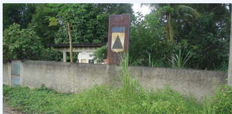
Escritório de Obras do Dnit em Teixeira de Freitas funciona num prédio em péssimo estado de conservação