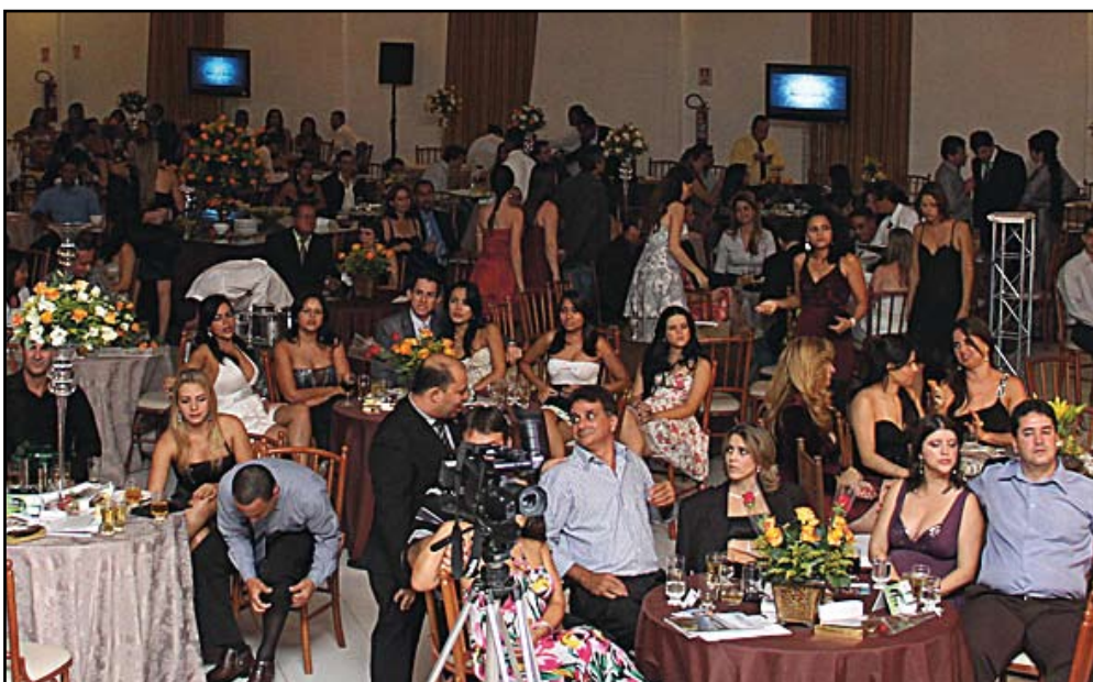
Visão panorâmica do Destaque Empresarial