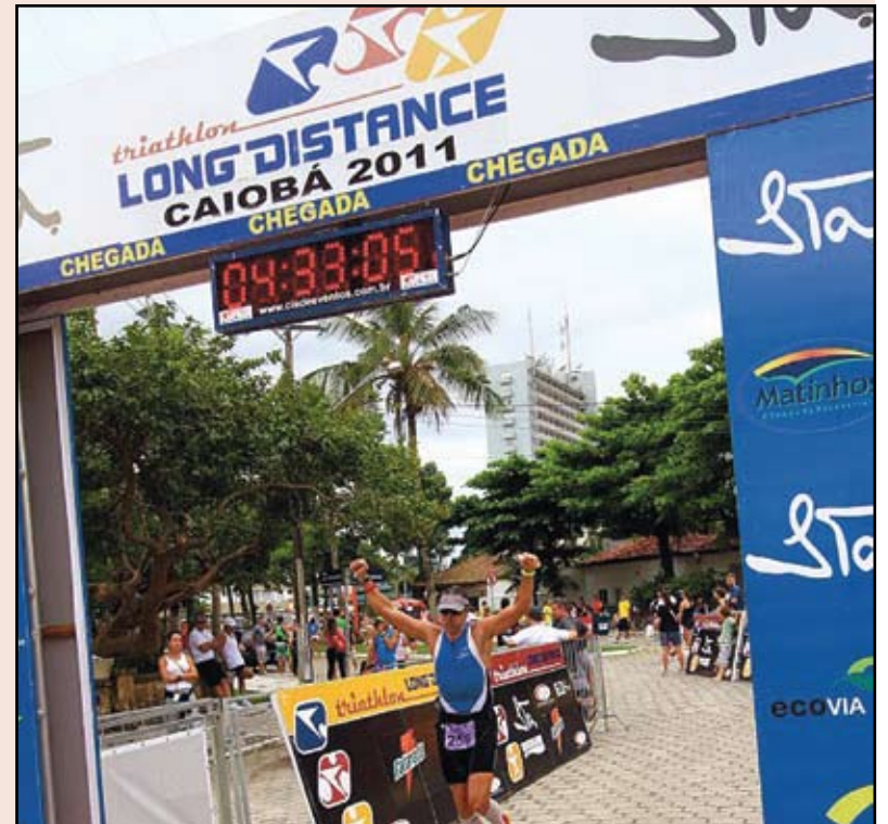
Cerca de 80 atletas participarão das provas de natação, ciclismo e corrida