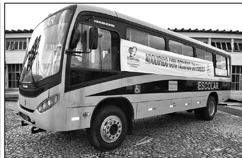
Durante a atual gestão, a frota de veículos do município foi totalmente renovada