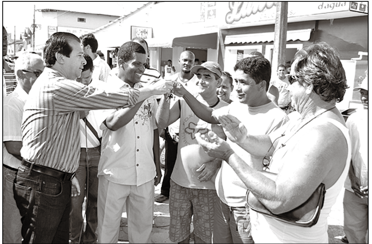
Visita do secretário foi comemorada pelos munícipes