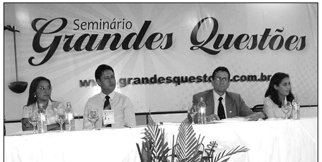
Mesa com autoridades

O evento aconteceu entre os dias 15 e 16 de abril, no Hotel Vela Branca.