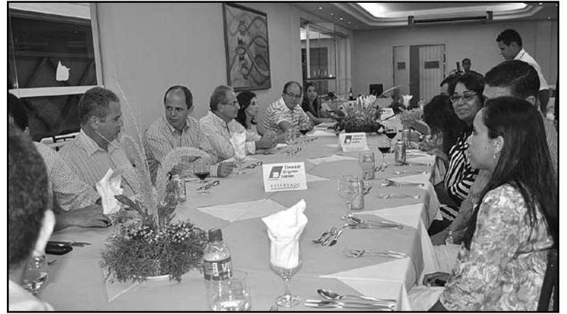
Mesa com autoridades

Para o consumidor fica o benefício do desconto real e o direito de concorrer a prêmios maravilhosos, sendo que está previsto o sorteio de 5 carros entre os vários prêmios, para o varejista a oportunidade de oferecer os seus produtos de ponta de estoque, reaquecer as vendas, recupe-